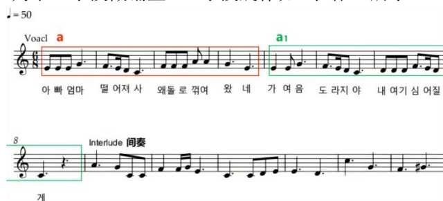
〈乐谱 3〉 《외로운 도라지야》A 乐段

国早期传统的民谣式音乐风格。其中，a 1 乐句结束部分使用了 fa - mi - re - do 的旋律构成，形成了半终止结束型，为下一乐段做铺垫。A 乐段旋律如〈乐谱 3〉所示。