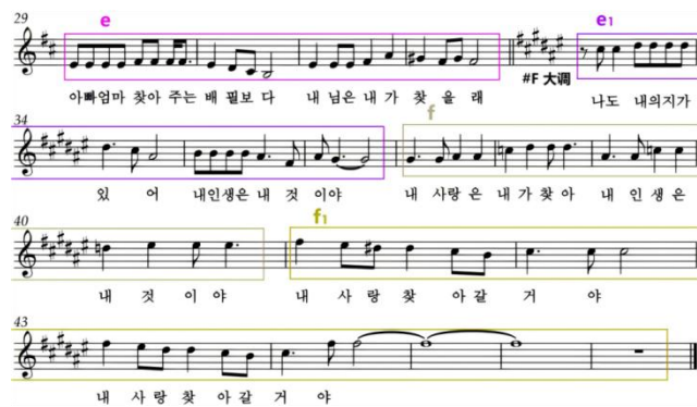
〈乐谱 4〉 《내 인생은 내 것이야》B 乐段

A 乐段为扩展型乐句群结构，其中 a、a 1 、c 乐句由 4 个小节组成，b、d 乐句由 5 个小节组成，这种结构多见于韩国传统民谣中。B 乐段属单二部并列式结构，由 A 大调转 #F 大调。f 和 f 1 乐句为主属关系，给人一种稳定感与圆满的感觉。在旋律音域方面，f 1 乐句扩展至小字二组的 #f 2 ，生动地将情感的递进与释放描述出来。B 乐段旋律如〈乐谱 4〉所示。